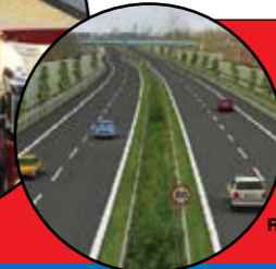
So soll die verlegte Wilhelmsburger Reichsstraße aussehen.