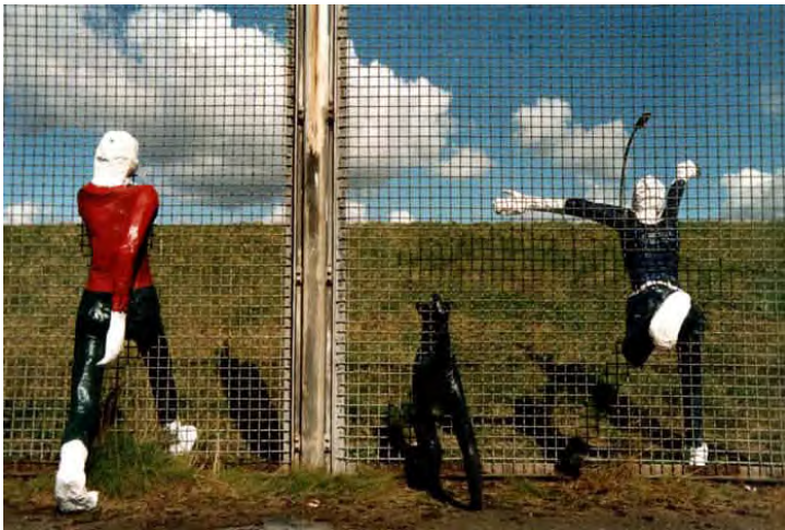
Grenzgänger (Elisabeth Richnow 2002)

„Die Verlegung des Freihafenzauns an das Nordufer des Spreehafens ist bereits heute möglich. Dies würde den Deich und die am Spreehafen gelegene Straße der ortsnahen Bevölkerung zugänglich machen. Ein attraktiver Naherholungsraum mit unverwechselbarer Aussicht könnte so gewonnen werden. Eine Fußgänger- / Radfahrerquerung am östlichen Ende des Spreehafens ist wünschenswert“ (S.23)